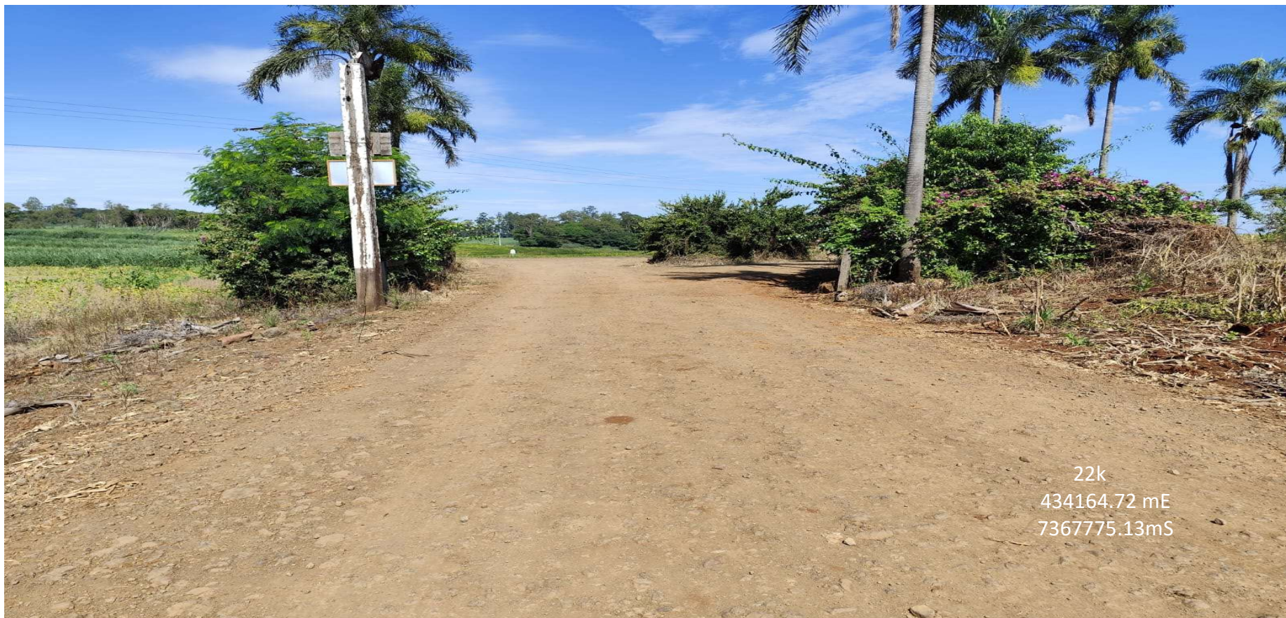
FOTO 01 – ESTRADA DO GUARACI - INICIO DO TRECHO – REMOÇÃO DE CAMADA VEGETAL

Rua da Bandeira, nº 500 | Cabral | Curitiba/PR | CEP 80035-270