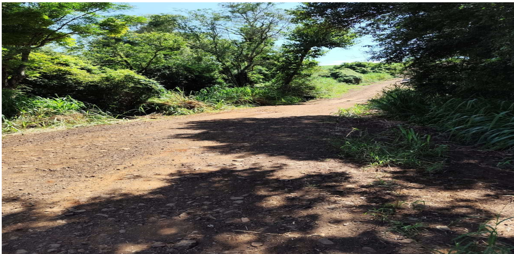
FOTO 02 – ESTRADA DO GUARACI - FINAL DO TRECHO – REMOÇÃO DE CAMADA VEGETAL

Rua da Bandeira, nº 500 | Cabral | Curitiba/PR | CEP 80035-270